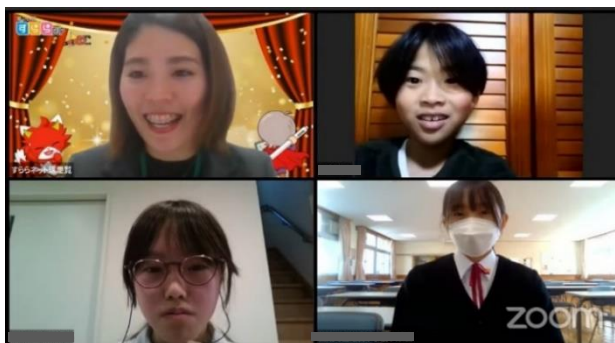
学校部門の個人アワード上位入賞者がコメントをする様子

参加対象数 428,121 人となった今回のすららカップでは、個人戦では 1,150 人、団体戦では 29 団体が表彰の対象となる成果を収めました。授与式に参加した上位入賞者は、「目標に向け隙間時間を使ってあきらめずに取り組んだ」「暇な時間を見つけて取り組んだ」と、小さな積み重ねが成果につながったことを話してくれました。また子どもたちのサポートをした先生からは、「コツコツ課題に取り組むことで、個々のスキルアップにつながる」とのコメントがありました。さらに「がんばった甲斐があった」「学校以外の事で賞が取れて嬉しい」と笑顔で感想を語る子どもたちも印象的でした。