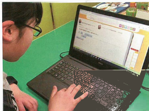
「すらら」で学習する生徒