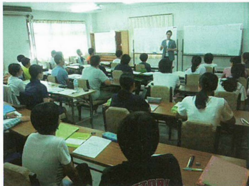
伝習館鳥取東町教室の教室風景

状況をオンタイムで講師が確認することができ、「家でも頑張っているね」、「努力をちゃんと見ているよ」といった励ましを適切なタイミングですることができる点が、従来型のICT活用教材とは大きく異なるという。